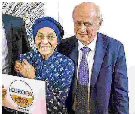
■ ALLE PAG. 2-3 Emma Bonino e Bruno Tabacci