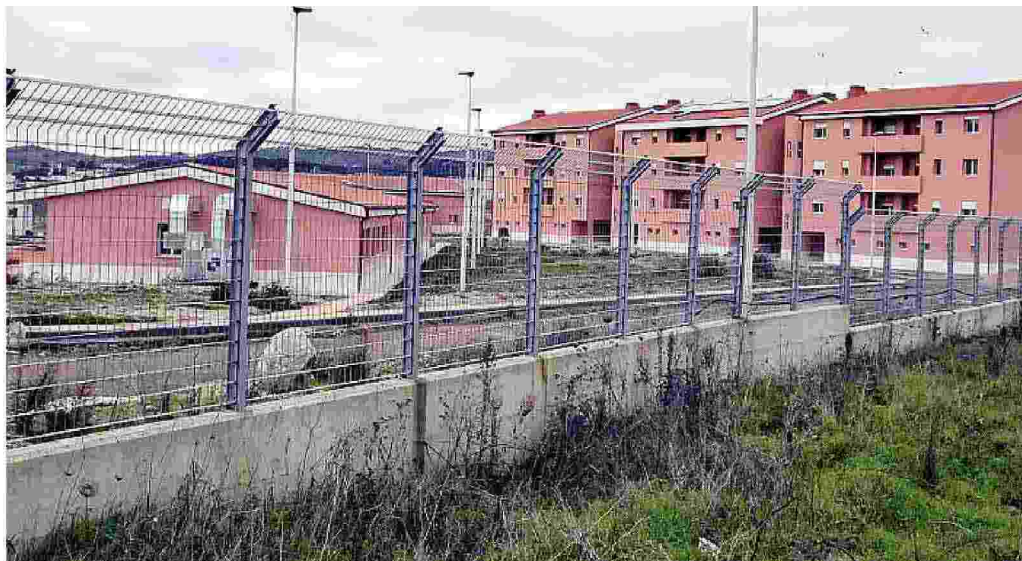
La caserma di Pratosardo è in fase di ultimazione e sarà consegnata al Comune a ottobre

«Ringraziamo il ministro Pinotti per l'impegno preso e per aver ribadito l'impegno dei suoi