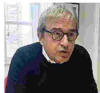
Il deputato Roberto Capelli

uffici, attraverso un tavolo di concertazione, per la predisposizione dell'accordo tra Stato e Regione per rideterminare la presenza militare in Sardegna – ha sostenuto il deputato Roberto Capelli –. Presenza definita im-